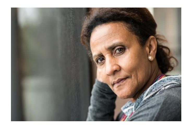
Sources: U.S. Department of Health and Human Services, National Institutes of Health, the National Alliance on Mental Illness.